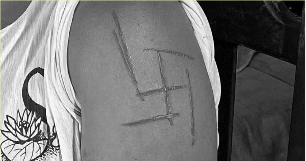
Figura 03. Mulher trans marcada com suástica

(MS), enganada por uma emboscada sob o pretexto de receber por seu trabalho como diarista, ela foi encurralada por seu namorado e seus patrões, que riam enquanto a golpeavam com tacos de sinuca e cabos de vassoura. A tortura apresentou um componente ainda mais perverso quando utilizaram uma faca quente para gravar uma suástica nazista em seu braço , um símbolo de extermínio que carrega séculos de ódio.